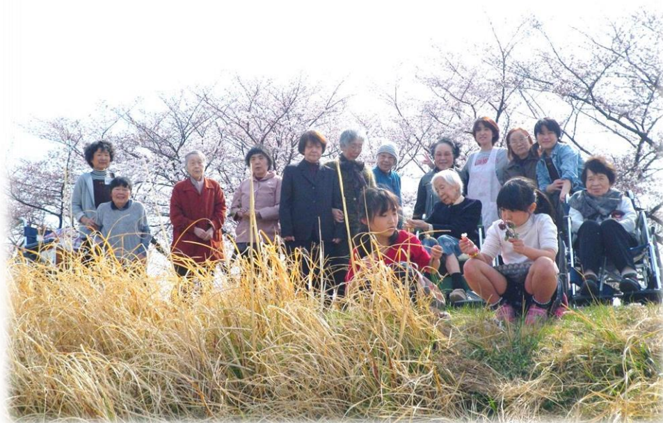
桜を探しにお出かけしました♪