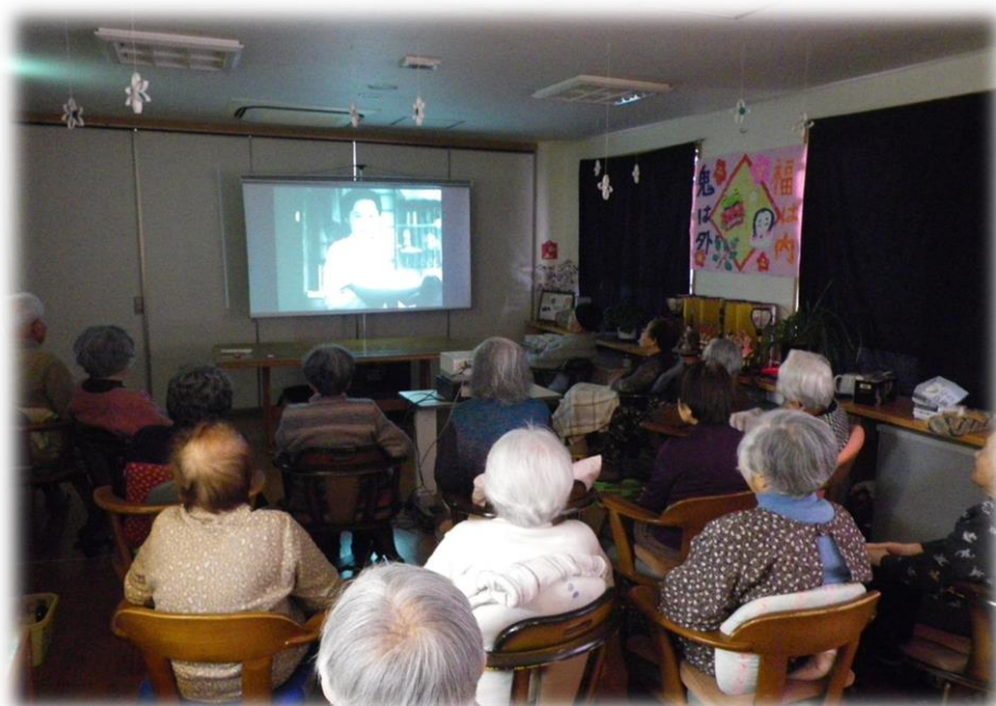
すずらん名画座の様子 割と人気です♪