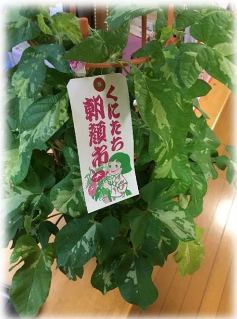
ご支援者より届きました♪