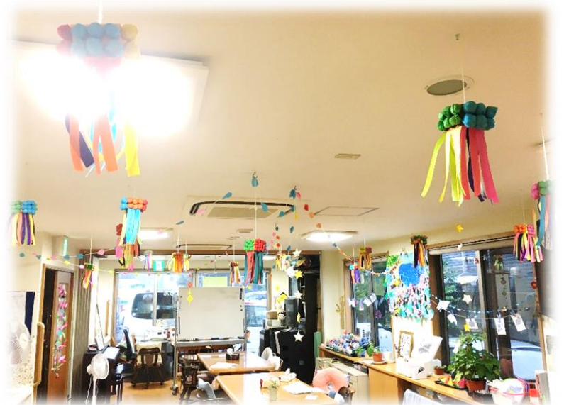
フロアーは皆さんの作品で溢れています♪