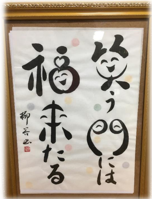
書道の先生より笑顔が届きました♪