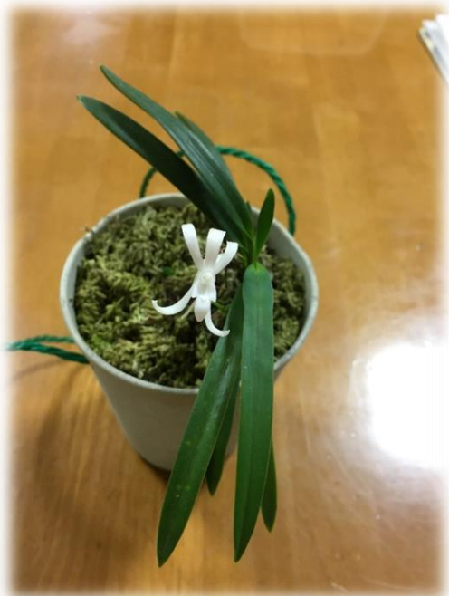
甘い香りの風蘭が今年も届きました♪